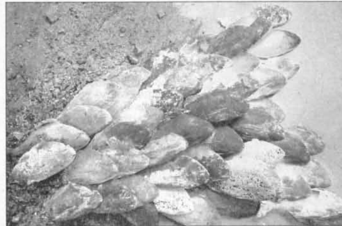
« Poissons pavés » de Natalie Reba. Technique de l'estampage.

Comme ces visages saisis dans le cristal au moment où ils vont s'embrasser... L'humour n'est pas absent. Voici les calices de